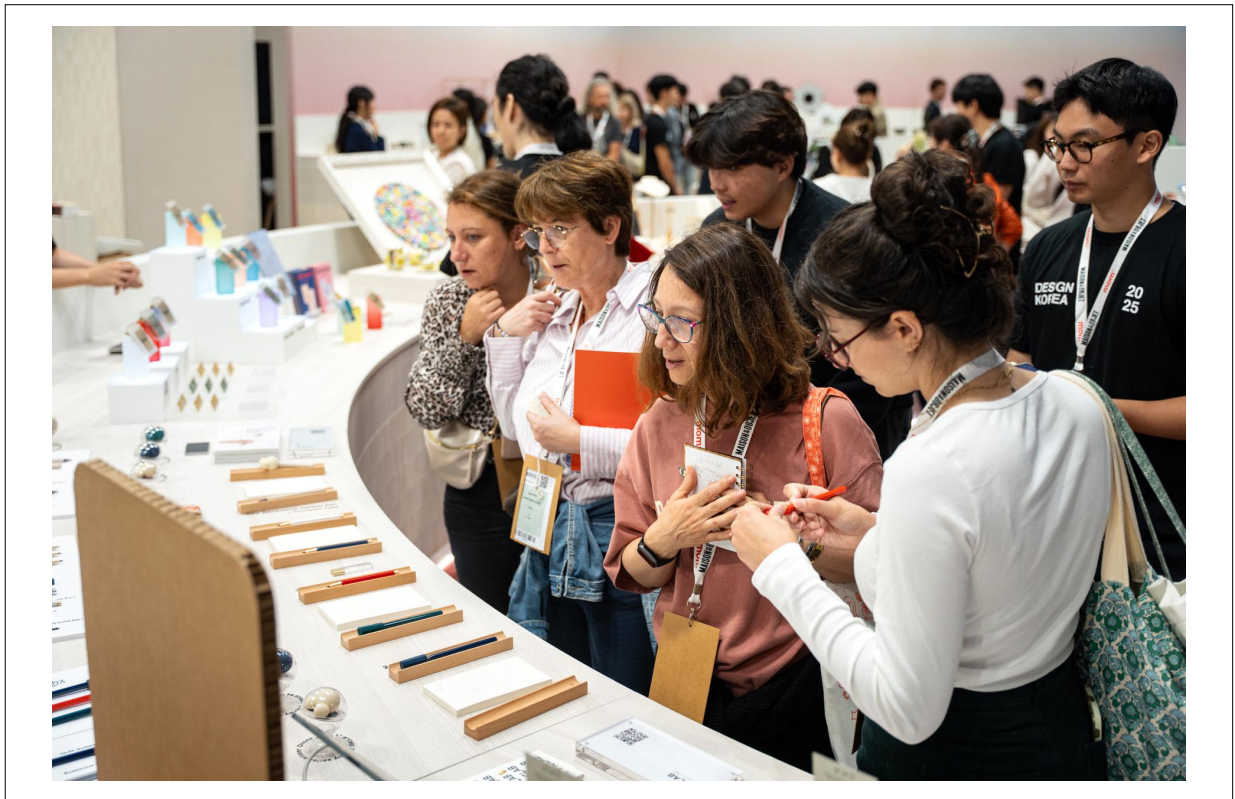
사진 2 : 메종&오브제 한국디자인관 제품을 보고 있는 관객들의 모습